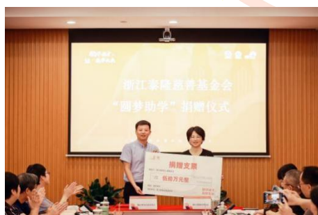
(图 4. 照片示例)

2) 照片要求：每场项目活动不少于提交 5 张照片，照片需包含活动流程每个环节的全景和局部特写。(照片可参照图 4、图 5)