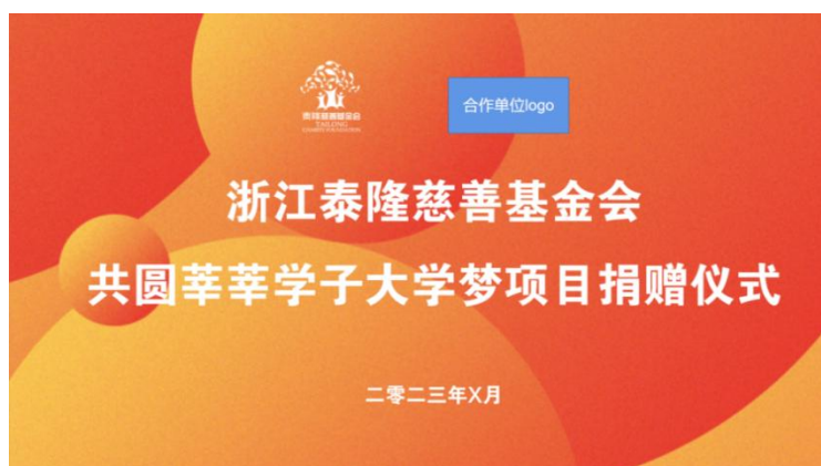
(图例 3. 示例)

2) 照片要求：每场项目活动不少于提交 5 张照片，照片需包含活动流程每个环节的全景和局部特写。(照片可参照图 4、图 5)