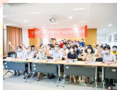
(图 5. 照片示例)